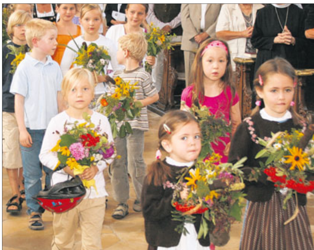
Mit ihren prächtig gebundenen Kräuterbuschen ziehen an Maria Himmelfahrt Jung und Alt in die Kirchen, um die besonderen Sträuße weihen zu lassen.