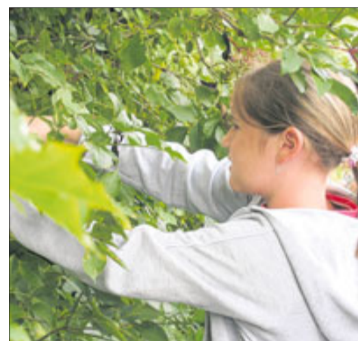
Nicht nur Erwachsene, auch Kinder waren mit Feuereifer beim Kräuter schneiden dabei.