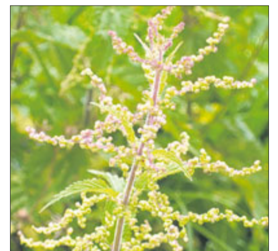
Brennnessel gehören unbedingt in einen Kräuterbuschen. Hier ein weibliches Exemplar.