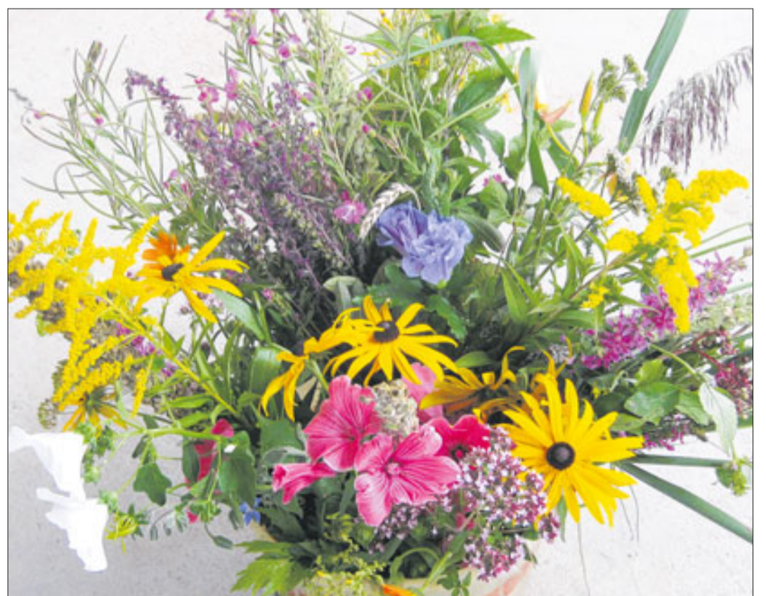
Fertig ist das Werk: Dieser Kräuterbuschen soll im kommenden Jahr Unheil von Haus, Hof und Familie abwenden.